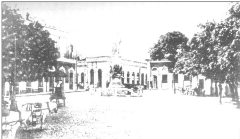
Figura 16. Praça Tamandaré, 1930