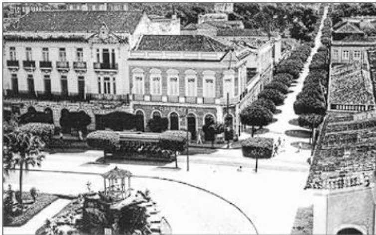
Figura 12. Manaus, década de 1930