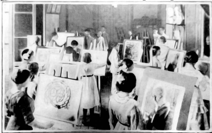
Figura 6. Sala de aula de desenho do Colégio Progresso Paraense