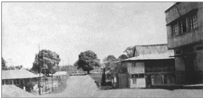
Figura 2. Av. Sete de Setembro, início dos anos 40. Da direita para a esquerda, a antiga Casa Três, os Correios e, ao lado, o Clube Internacional onde funcionava a escola Tobias Barreto