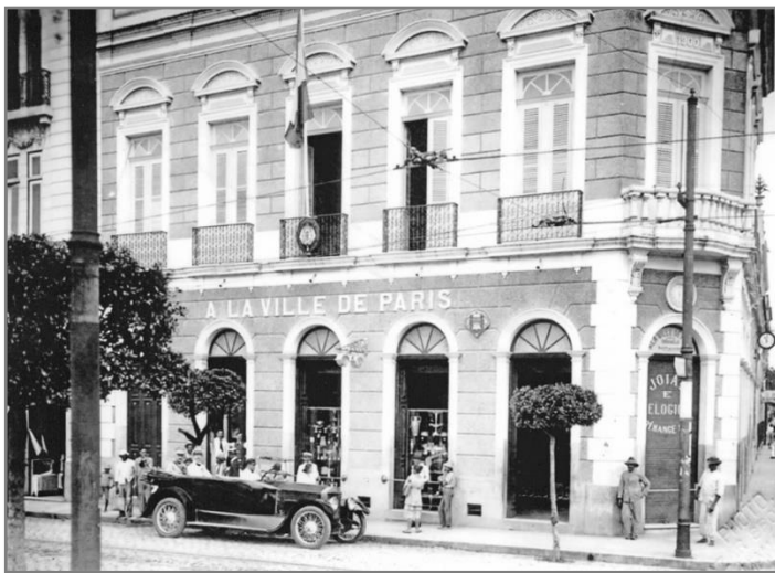
Figura 11. Manaus, década de 1930