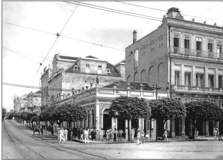
Figura 10. Manaus, década de 1930