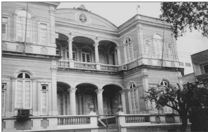
Figura 22. Faculdade de Direito da Universidade Federal do Amazonas (Ufam)