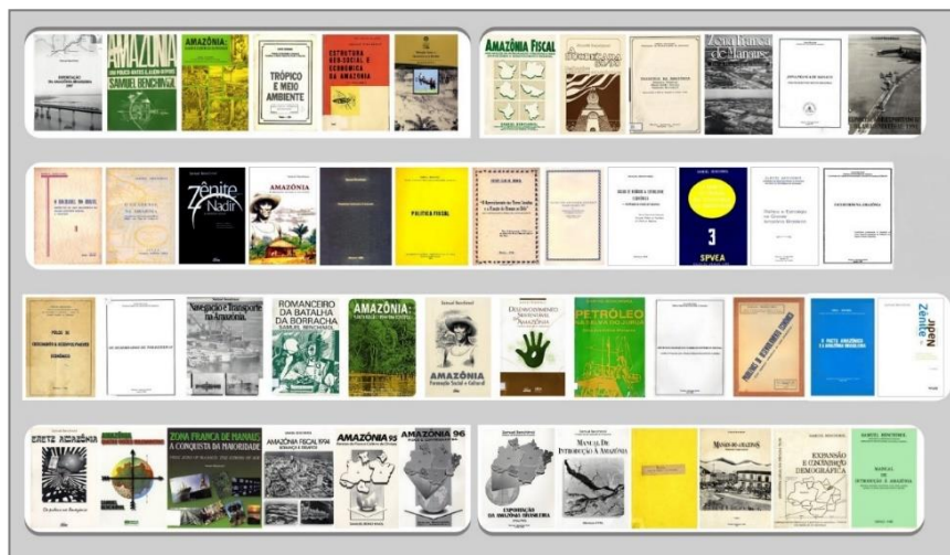
Figura 1. Capa de algumas obras de Samuel Benchimol