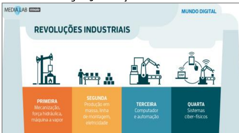
Figura 3. Revoluções Industriais

A representação esquemática a seguir sintetiza o evoluir do mundo, movido pelas revoluções industriais, segundo os paradigmas históricos subjacentes aos avanços tecnológicos que, em si próprios, distinguem nações avançadas e estagnadas ao longo da história. O Brasil, constata-se, tem presença muito discreta no processo.