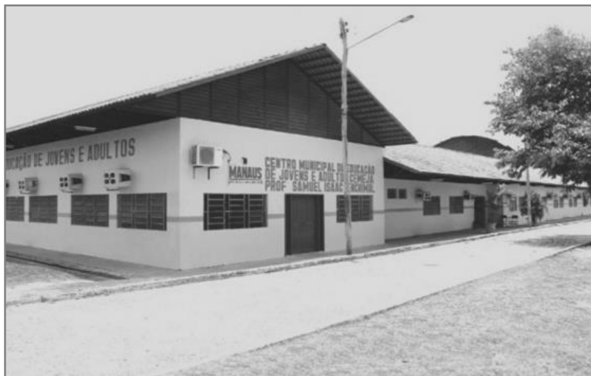
Figura 21. Fachada da Escola Municipal Prof. Samuel Benchimol