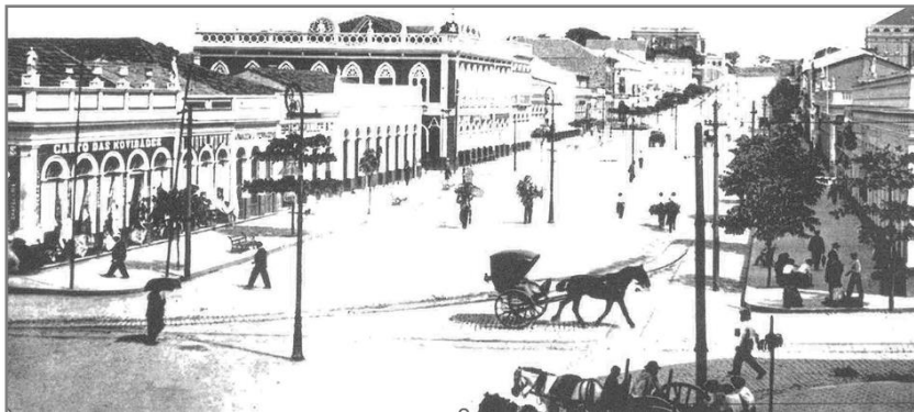
Figura 14. Avenida Eduardo Ribeiro, 1902