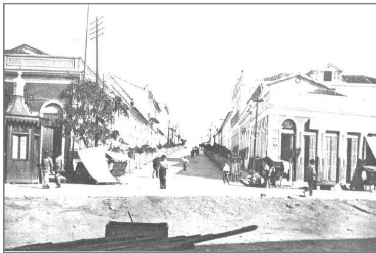
Figura 17. Rua dos Remédios, 1930, hoje Rua Miranda Leão