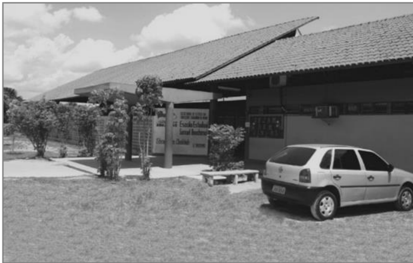
Figura 20. Fachada da Escola Estadual Prof. Samuel Benchimol